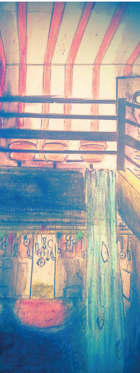
Visuel du projet de scénographie