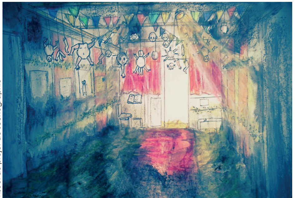
Visuel du projet de scénographie